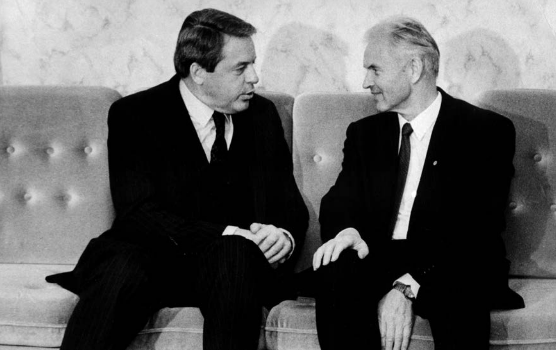
Der österreichische Bundeskanzler Franz Vranitzky (links) trifft am 24. November 1989 den neuen Ministerpräsidenten der DDR, Hans Modrow, in Ost-Berlin.