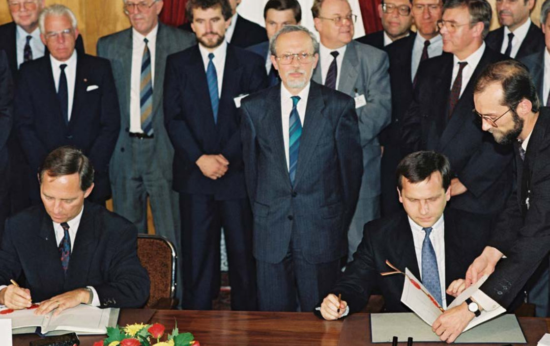
Unterzeichnung des Einigungsvertrages am 31. August 1990.