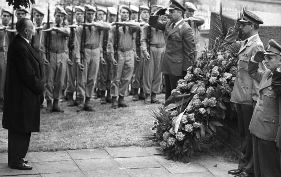
Bundeskanzler Konrad Adenauer 1962 auf dem deutsch-französischen Soldatenfriedhof in Versailles.