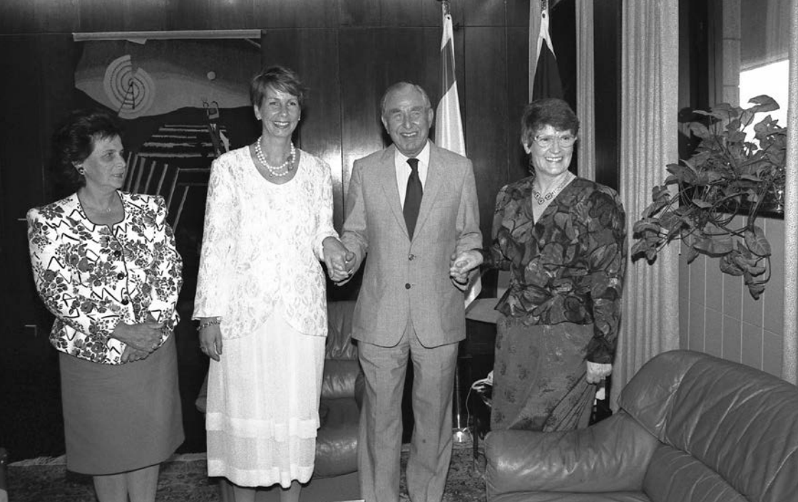
Israels Präsident Chaim Herzog empfängt am 26. Juni 1990 die Präsidentinnen des Bundestages und der Volkskammer, Rita Süßmuth (rechts) und Sabine Bergmann-Pohl (2. v. links).