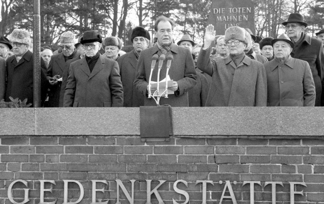
DDR-Führung bei der Liebknecht-Luxemburg-Demonstration am 15. Januar 1989.