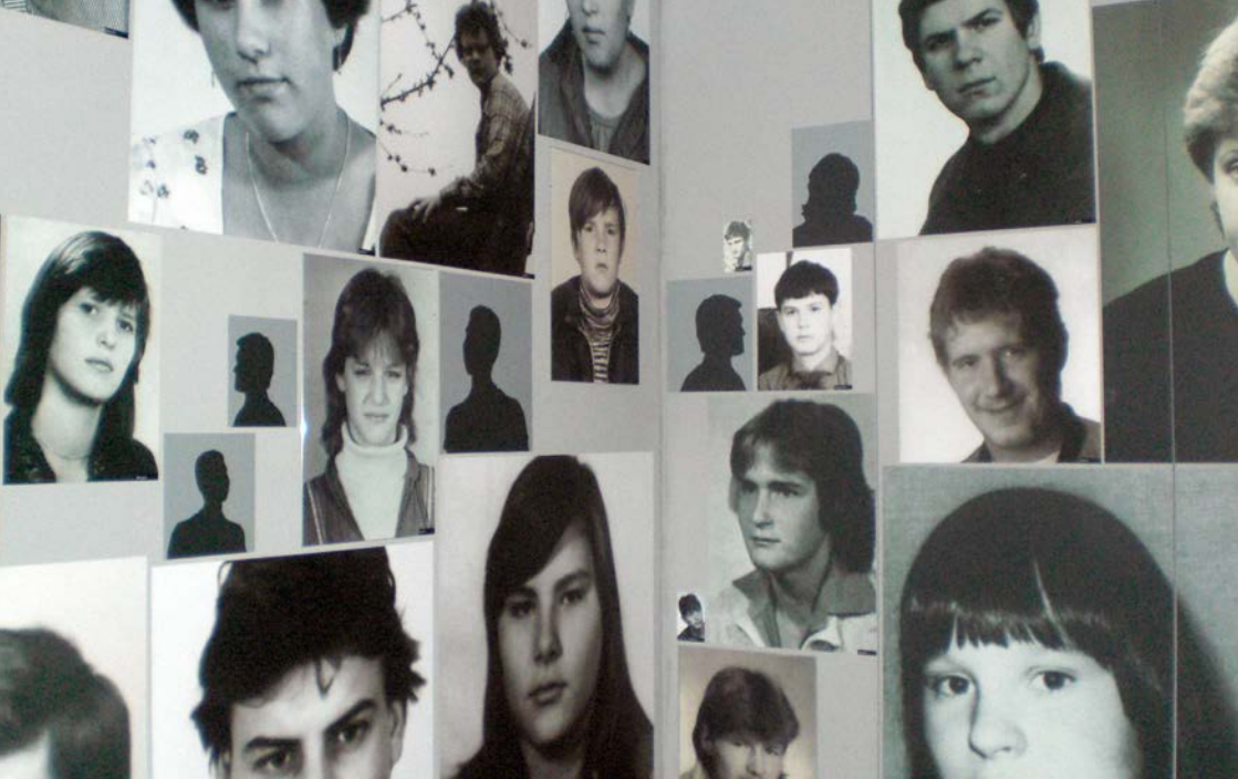
Ausstellung im ehemaligen Geschlossenen Jugendwerkhof Torgau.