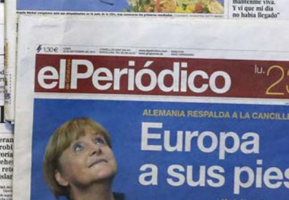
Schlagzeilen spanischer Zeitungen nach der Bundestagswahl 2013.