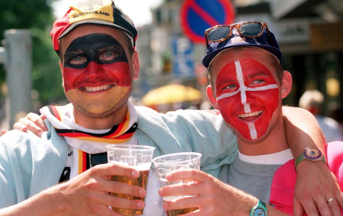
Ein dänischer und ein deutscher Fan am Rande der Fußball-Europameisterschaft 1992.