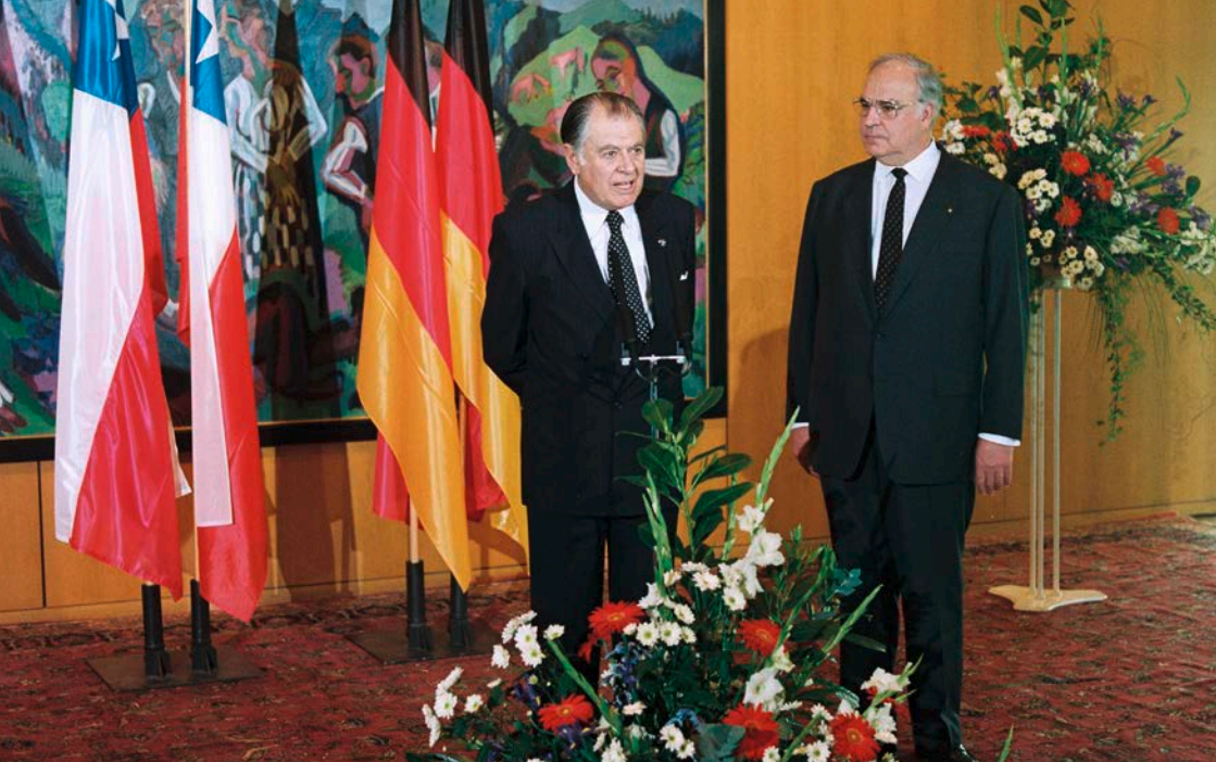
Chiles Präsident Patricio Aylwin am 25. April 1991 mit Bundeskanzler Helmut Kohl in Bonn.