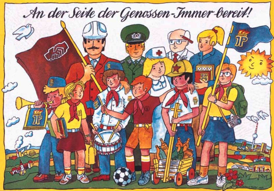
Werbeplakat der Jungen Pioniere 1986.