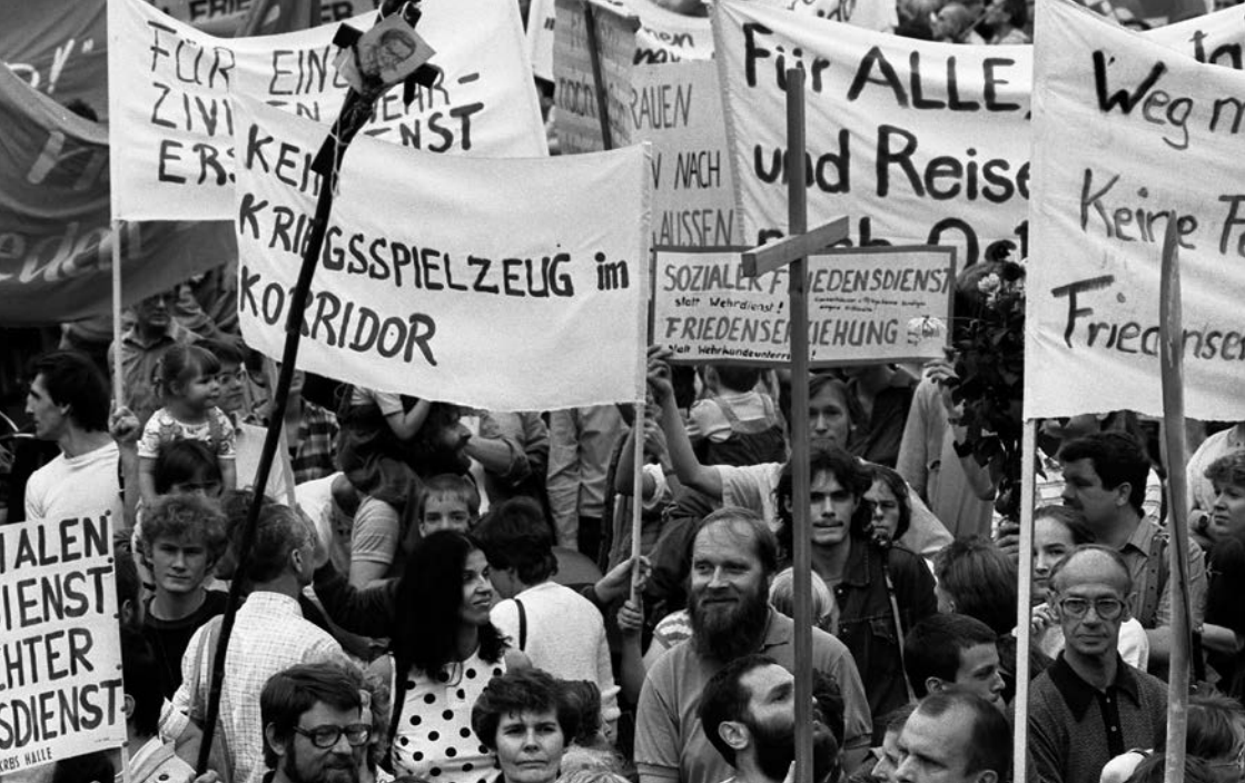
Kundgebung auf dem Dresdner Schlossplatz am 18. September 1987.